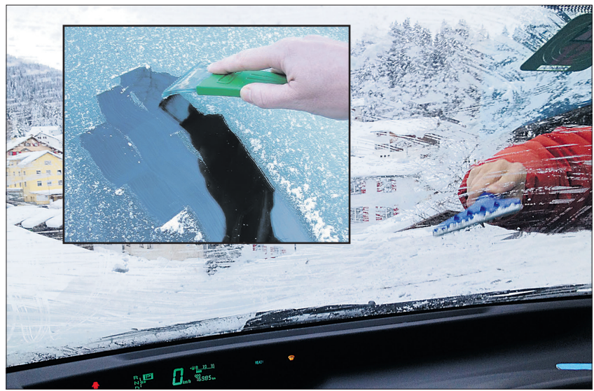
Kleine Gucklöcher, grosse (Ausweisentzugs-)Gefahr: Wer fahren will, verschafft sich besser einen umfassenden Durchblick.